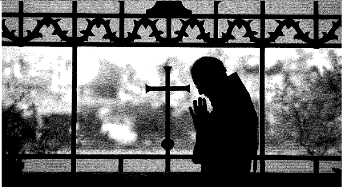
Vito Mancuso: domani sarà a Belluno nell'aula magna dell'Istituto Catullo. A destra, un'immagine di religiosità e fede: un monaco prega nella chiesa del Dominus Flevit a Gerusalemme