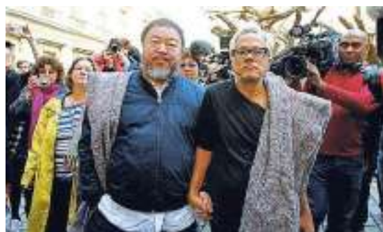
GLI ARTISTI Da sinistra Ai Weiwei e Anish Kapoor per le strade di Londra lo scorso anno

curo, le sue opere erano già in viaggio: «Devo ancora decidere». Il 9 settembre, quando la biennale ha aperto, si è capito che aveva scelto di esserci. Ai Weiwei, che la prossima settimana inaugurerà la mostra a Palazzo Strozzi di Firenze, con un tweet si è lamentato del fatto che nessun artista abbia reagito alla sua esclusione. «Non è una cosa sorprendente per il mercato dell'arte cinese», ha aggiunto sottolineando però che la maggioranza degli oltre 70 artisti presenti alla biennale non sono cinesi. «Kapoor sì, Weiwei no», hanno risposto alcuni utenti postando la foto dei due colleghi a braccetto per le strade di Londra.