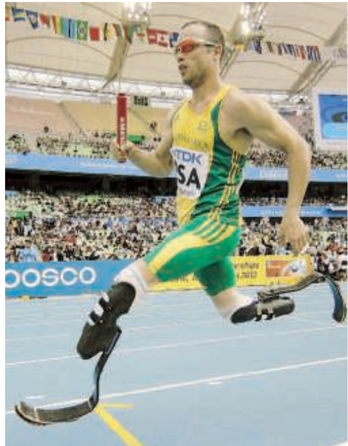
Oscar Pistorius si è guadagnato il pass per la staffetta 4x400