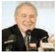
A PAGINA 44