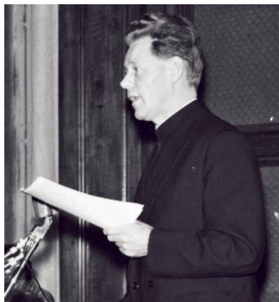
▲ Progressista Hans Küng (1928-2021) è stato un teologo cattolico del dissenso. Qui sopra, una sua foto giovanile; in alto, un ritratto più recente

Si aggiunsero altri motivi di dissenso: il ruolo della donna, la sessualità, l'eutanasia, il celibato