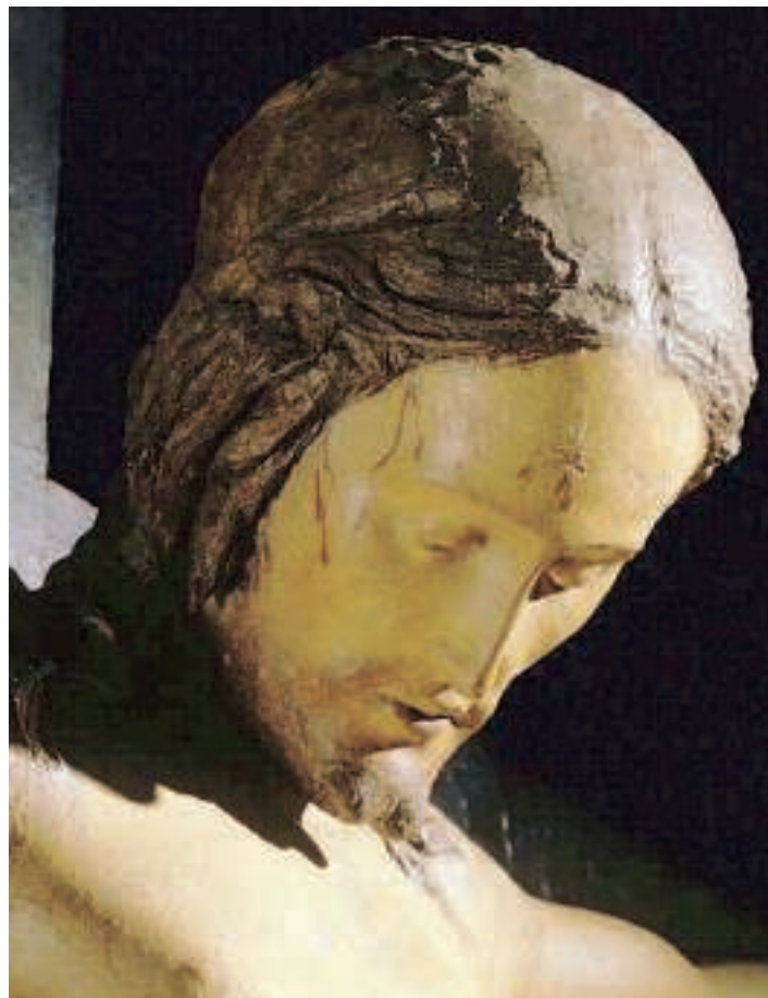
MICHELANGELO Cristo crocifisso (1492-1493), legno di tiglio intagliato e policromato dai Musei Civici di Firenze, Chiesa di Santo Spirito

Il risultato non poteva che essere questo, perché il cristianesimo vive esattamente dell'idea che la perfetta divinità, cioè la più alta trascendenza, si rispecchia pienamente nella perfetta umanità, cioè nella più concreta immanenza. Che poi il volto di Cristo sia stato raffigurato nel primo millennio più all'insegna della trascendenza in quanto Pantocrator, e nel secondo millennio più all'insegna dell'immanenza in quanto Crocifisso, fa parte della dialettica teologica fondamentale evidenziata sopra. Come poi andranno le cose nel terzo millennio, se si giungerà a una sintesi matura oppure a una sorta di apofasi iconica, nessuno lo sa.