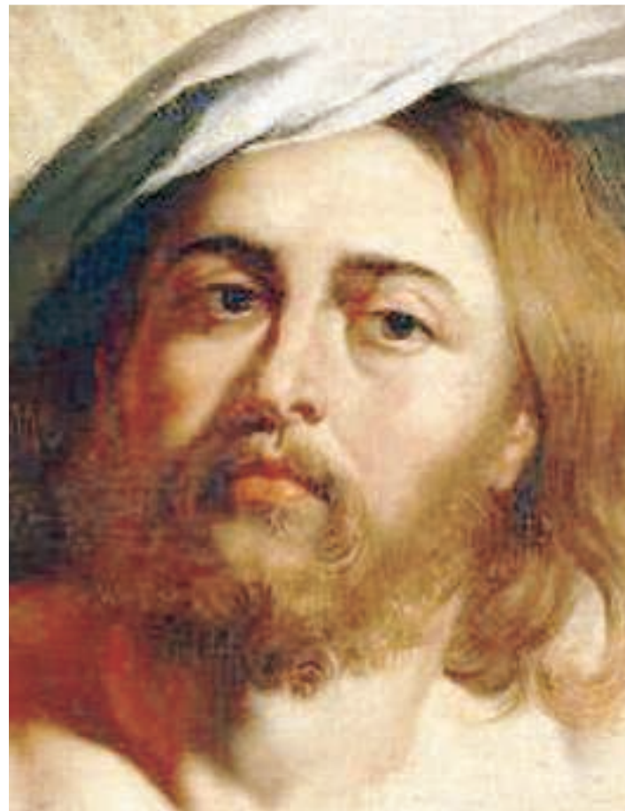
PIETER PAUL RUBENS Cristo risorto (1615-1616), olio su tela dalla Galleria Palatina di Palazzo Pitti, Firenze