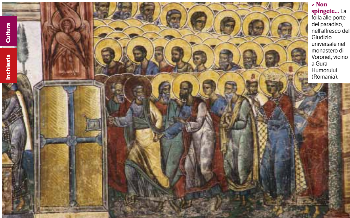
✓ Non spingete... La folla alle porte del paradiso, nell'affresco del Giudizio universale nel monastero di Voronet, vicino a Gura Humorului (Romania).