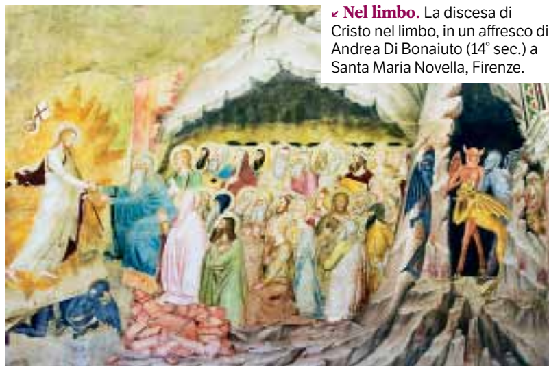
✓ Nel limbo. La discesa di Cristo nel limbo, in un affresco di Andrea Di Bonaiuto (14° sec.) a Santa Maria Novella, Firenze.

non un evento istantaneo. E non possiamo considerare come indizio oggettivo l'esperienza soggettiva delle persone, di chi ha avuto la percezione di un contatto con l'aldilà o di aver vissuto qualcosa di trascendente.