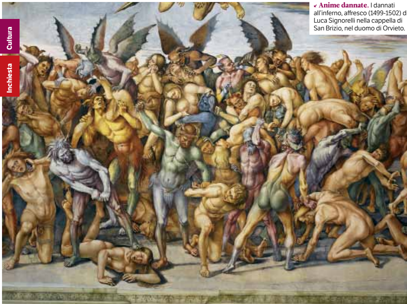
✓ Anime dannate. I dannati all'inferno, affresco (1499-1502) di Luca Signorelli nella cappella di San Brizio, nel duomo di Orvieto.

“L'aldilà, se c'è, potrebbe essere una dimensione che va oltre le nostre percezioni”