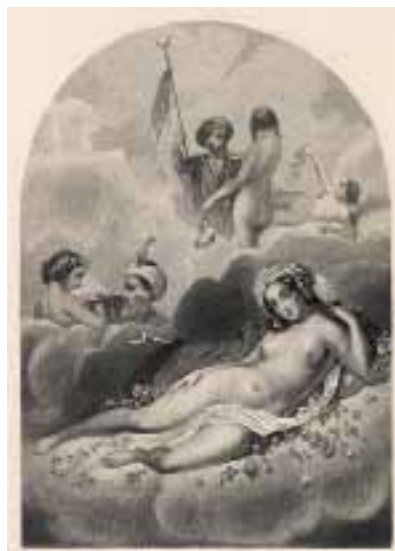
↑ Aldilà erotico. Il paradiso dei musulmani: chi vi giunge è ricompensato da fanciulle, le “Uri”.

Egizio: al regno dei morti si arrivava con la barca solare. Osiride presiedeva 42 giudici che pesavano il cuore dei defunti. Se era leggero, per mancanza di colpe, si era ammessi. Altrimenti si moriva per sempre.