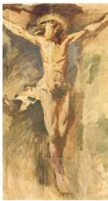
PICASSO Pablo Picasso: Cristo crocifisso (1896-1897)