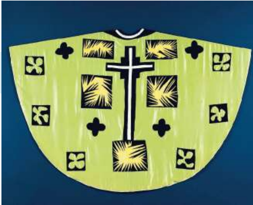
MATISSE Henri Matisse: Casula verde (1951)

Bellezza divina tra Van Gogh, Chagall e Fontana, Firenze, Palazzo Strozzi fino al 24 gennaio 2016. Promossa e organizzata da Fondazione Palazzo Strozzi, Arcidiocesi di Firenze. Orari: 10-20; giovedì 10-23. Dalle 9 solo su prenotazione. Biglietti: intero 10 euro. Info: 055 2645155. Prenotazioni: 055 2469600. Catalogo: Marsilio. Sito: www.palazzostrozzi.org